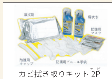
カビ拭き取りキット ツーピー