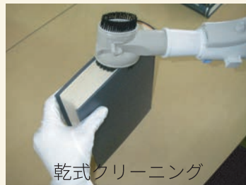
乾式クリーニング

書庫内での作業のほか、お預かりしての作業もできます。対象資料の状態にあわせて、乾式または湿式でのクリーニング作業を行います。