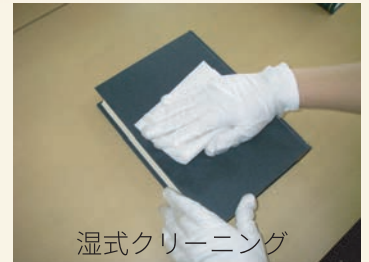
湿式クリーニング