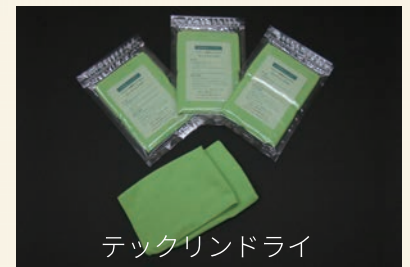
テックリンドライ